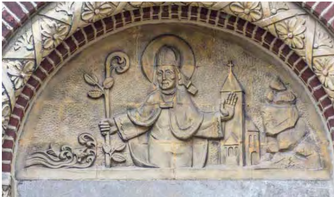
Tympanon (hl. Gregor) über dem linken Seitenportal in der Kirche in Nieuwenhagen, Provinz Limburg