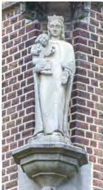
Statue der hl. Maria mit dem Jesusknaben an der Kirche in Nieuwenhagen, Provinz Limburg

Ausstellung mit einem Verkaufsraum. Kunstkeramik wurde auch im Schaufenster eines kleinen Gebäudes direkt an der Provinzialstraße gezeigt.