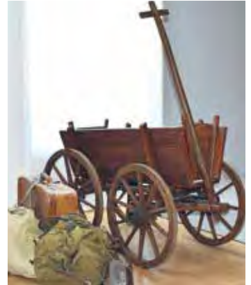
Die Flucht aus der Heimat traten die Menschen mit diesen Karren an

Ein weiteres Haus thematisiert die Wirtschafts- und Sozialgeschichte Schlesiens. In der Erinnerung vieler Schlesier spielt die charakteristische schlesische Gutshofwirtschaft eine große Rolle, aber auch für die Region spezifische handwerkliche Produkte und Industriezweige, vor allem der Bergbau. Eine besondere Rolle nimmt das Weberhandwerk ein, dem Gerhart Hauptmann mit seinem bekanntesten Werk „Die Weber“ ein Denkmal gesetzt hat, das die sozialen Verwerfungen der Zeit thematisiert. Die Kultur- und Wissenschaftsmetropole Breslau symbolisiert im nächsten Haus nicht nur den historischen Bruch von 1945, sondern auch ein Zusammenwachsen von Vergangenheit und Gegenwart seit der politischen Wende 1989. Als Europäische Kulturhauptstadt 2016 und als junge, von vielen Hochschulen geprägte Stadt macht sie auch in