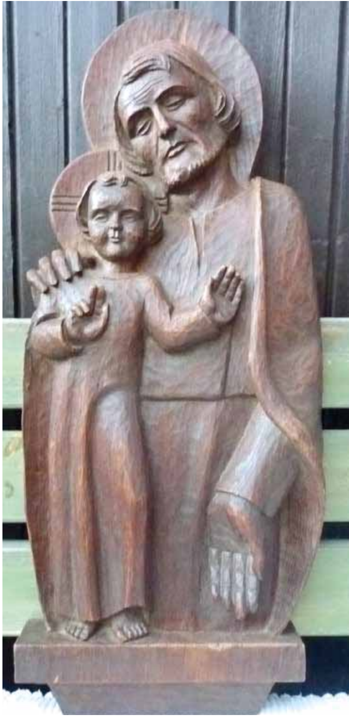
Relief „St. Joseph mit Jesuskind“, Eiche, 70 cm