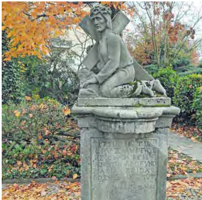
Bildwerk „Jesus fällt unter dem Kreuz“