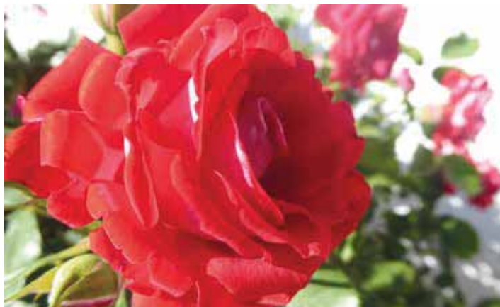
Rosenkavaliere – leider nicht selten ein Albtraum