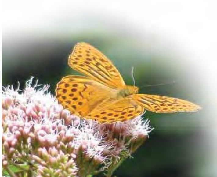
Der Kaisermantel ist Schmetterling des Jahres 2022

Eine Situation gibt es aber doch, wo sich die galanten Kaisermantel sehr flatterhaft geben: Wenn ein Männchen auf ein Weibchen trifft und seine Lockstoffe (Pheromone) verströmt. Dann fliegt das Weibchen mit zittrigem Flügelschlag geradeaus, während es vom Männchen schwirrend oben und unten, hinten und vorne umkreist wird. Die sommerlichen Flugkünstler bevorzugen als Nahrungsquelle die Blüten von Wasserdost, Flockenblumen, von Wald-Engelwurz oder Skabiosen sowie von jenen Pflanzen, die manchen Menschen ein Dorn im Auge sind: Brombeeren und Disteln!