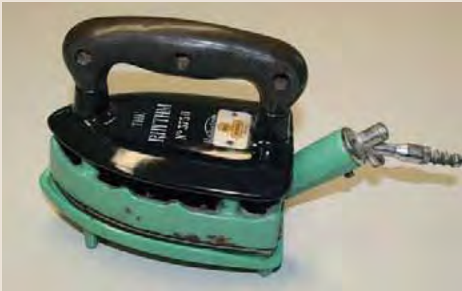
Bad Honnef AG