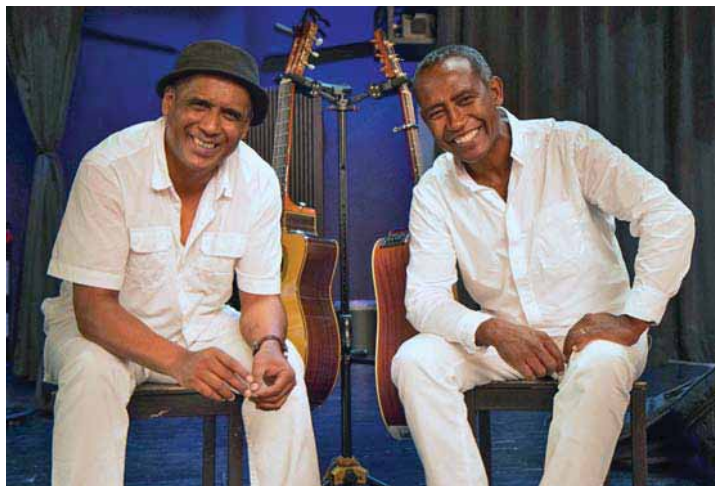
FiF / Bernd Leideritz