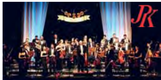
Die Junge Philharmonie Köln

Freunde und Förderer der Jungen Philharmonie Köln e.V. www.junge-philharmonie-koeln.com