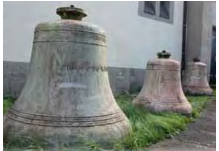
Die ausgeschiedenen Glocken von St. Michael