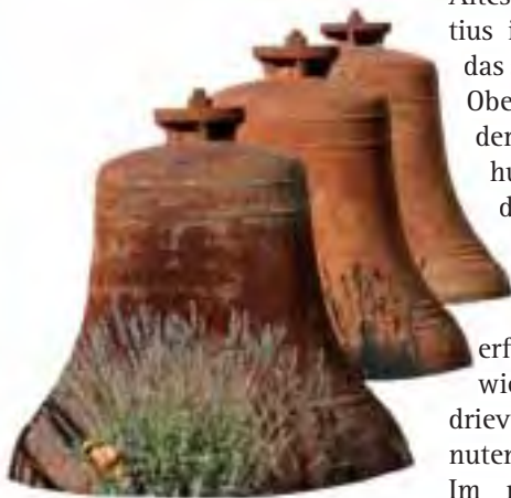
Stahlglocken von St. Laurentius

Wie oft mochten sie so geklungen haben, bis im Weltkrieg 1917 die beiden Größten das Brüllen der Kanonen erlernen mußten. Mit stillen scheuen Tränen sah die Gemeinde sie von dannen fahren....“