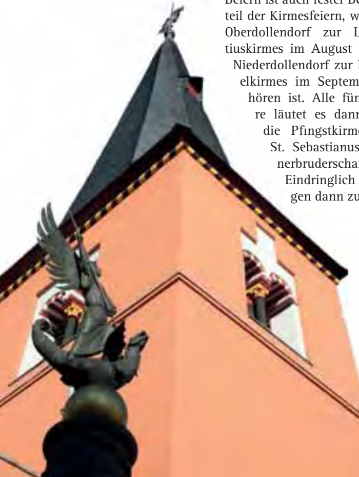
Pfarrkirche St. Michael

Alois Döring: Glockenbeiern im Rheinland. BRV Beiträge zur Rheinischen Landeskunde, Rheinland Verlag, 1988, erhältlich nur noch über Antiquariate.