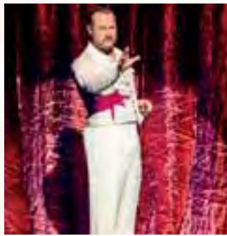
Szene aus „Nessun Dorma“

rheinkiesel verlost ein Weihnachts-Abo „62“ für eine Person im Wert von 151,50 Euro inklusive dem Magazin „kultur“ und KulturCard. Für das Abo gelten die Bedin-