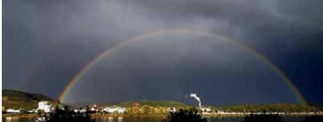
Regenbogen mit Nebenbogen

die Dichte der Regentropfen gering und sind die Wolken hell und luftig, vermögen wir kaum etwas oder gar nichts zu sehen. Vor einer kompakten, schwarzen Wolkenwand hingegen hebt sich ein Regenbogen kontrastreich ab.