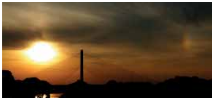
Ein Halo der Sonne

Auch in anderen Situationen zeigen sich Spektralbögen oder auch kurze, gekrümmte Streifen, also Regenbogen-Fragmente. Denken wir beispielsweise an Fontänen, Wasserfälle und aufspritzende Gischt, wo das Sonnenlicht in bunte Farben gebrochen wird. Genau dies passiert auch bei feuchtem Wetter wie Nebel mit Nebelbogen , Wolken mit Wol-