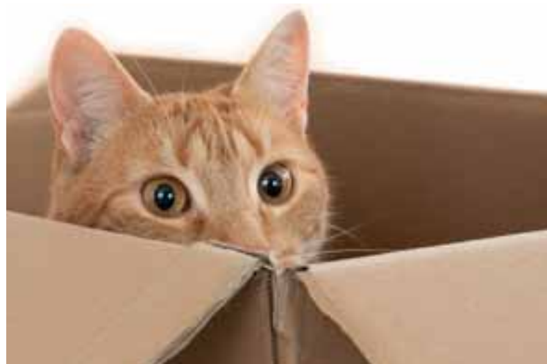
Darf die Katze mit umziehen?

Wenn ein Eigentümer seine Wohnung vermietet, muss er zunächst die Regelungen im Mietvertrag mit der Hausord-