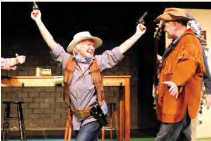
Die glorreichen Sechs