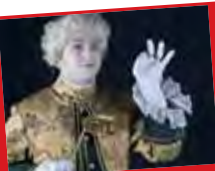
Die historische Stadtrevue