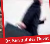
Dr. Kim auf der Flucht