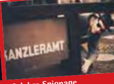
50 Jahre Spionage